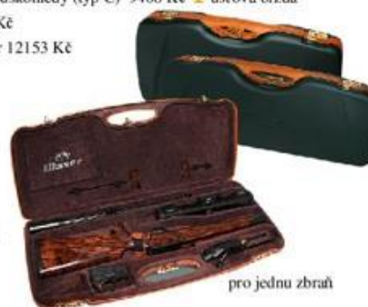
pro jednu zbraň