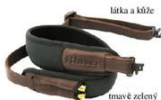
látka a kůže