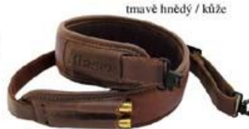
tmavě hnědý / kůže